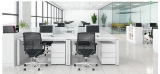
Büros und Konferenzräume