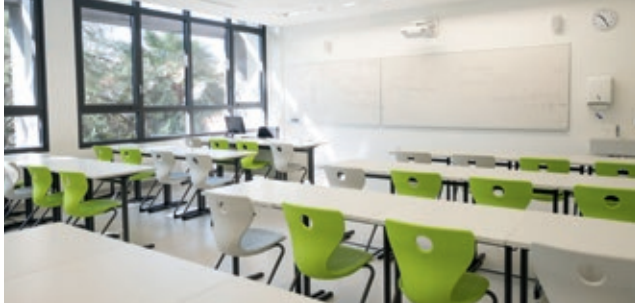
Schulen und Universitäten