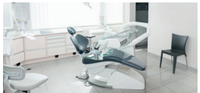
Wartezimmer und Arztpraxen