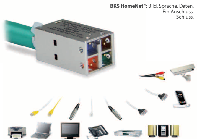
BKS HomeNet®: Bild. Sprache. Daten. Ein Anschluss. Schluss.

HomeNet schafft das mit dem kleinstmöglichen Aufwand. Pro Multimedia Anschluss wird ein Kabel benötigt. Dank dem 4-Kammern-Prinzip der Multimediabuchse können bis zu vier Dienste gleichzeitig übertragen werden. Das System MMC3000pro ermöglicht die gleichzeitige, 4-fache Nutzung dieses superschnellen Daten-Highways.